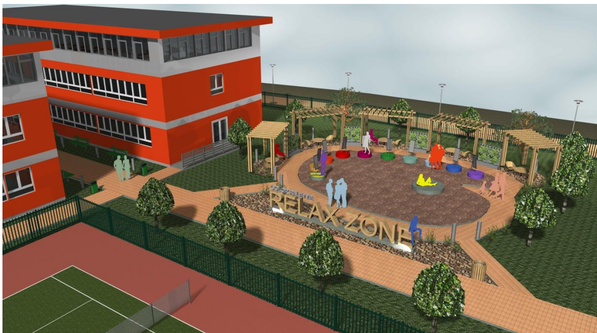
Pohled od východu