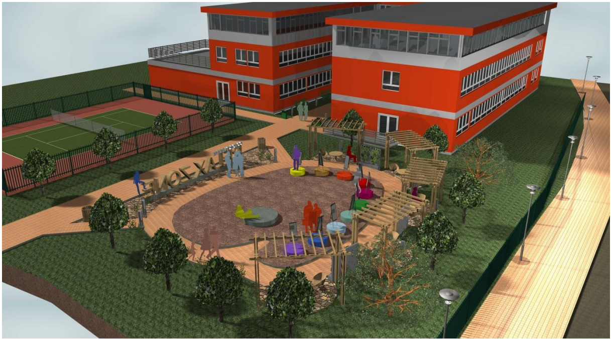
Pohled od západu